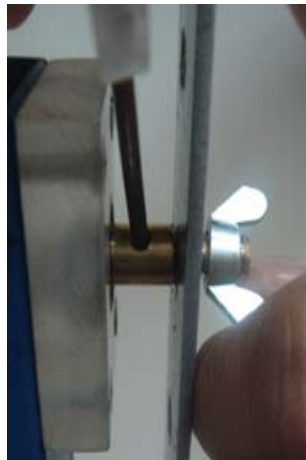
Gambar 3, Cara memasang bandul pada poros.